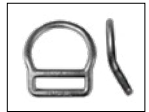
Halteöse (D-Ring, gebogen), geschmiedeter Stahl