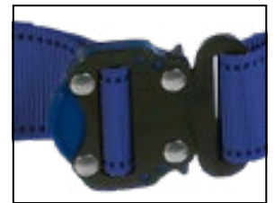
Schnellverschluss, beschichteter Stahl