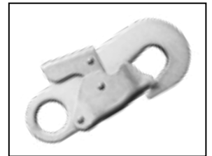
IKV 06 (EN 362:2004)