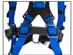
einstellbarer brustumlaufender, dorsaler Riemen