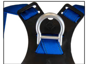
Auffangöse (D-Ring), Aluminium