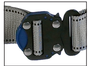
Schnellverschluss, beschichteter Stahl