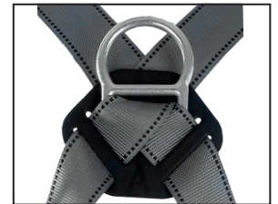
Auffangöse (D-Ring), geschmiedeter Stahl