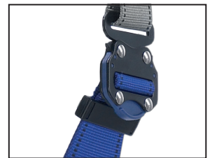
Schnellverschluss, beschichteter Stahl