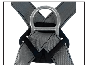
Auffangöse (D-Ring), geschmiedeter Stahl