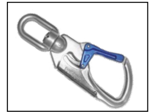
IKV 21 (EN 362:2004) mit Fallanzeiger