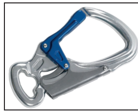
IKV 11 (EN 362:2004)