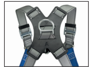
Auffangöse (D-Ring), geschmiedeter Stahl