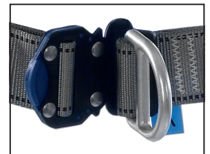
Schnellverschluss mit Steigschutzöse (Brust), geschmiedeter Stahl