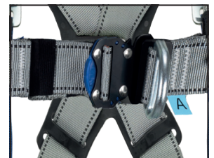
Schnellverschluss (beschichteter Stahl) mit Steigschutzöse (geschmiedeter Stahl)