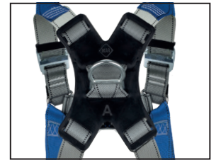
Auffangöse (D-Ring), geschmiedeter Stahl