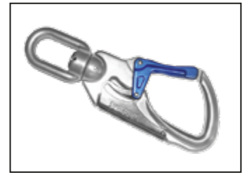
IKV 21 (EN 362:2004-T) mit Fallanzeiger