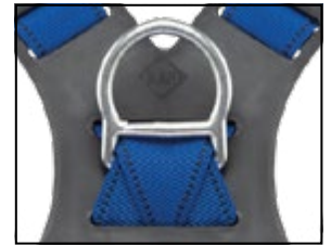
Auffangöse (D-Ring), geschmiedeter Stahl