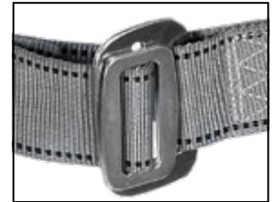
Steckverschluss (Brust), galvanisch verzinkt