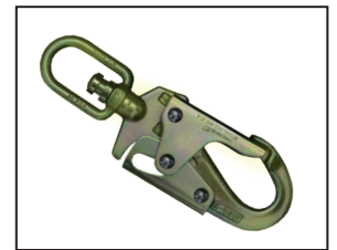
IKV 33 (ANSI Z.359.1-2007; CSA Z259.12-2011) mit Fallanzeiger