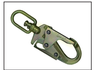
IKV 23 (ANSI Z.359.1-2007; CSA Z259.12-2011) mit Fallanzeiger