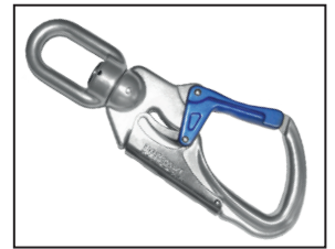
IKV 21 (EN 362:2004-T) mit Fallanzeiger