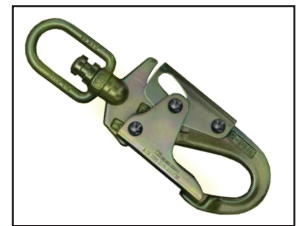
IKV 33 (ANSI Z.359.1-2007; CSA Z259.12-2011) mit Fallanzeiger