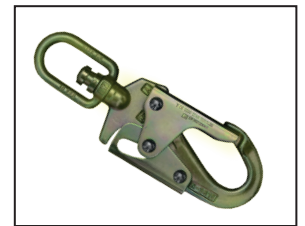
IKV 33 (ANSI Z.359.1-2007; CSA Z259.12-2011) mit Fallanzeiger