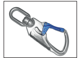
IKV 21 (EN 362:2004-T) mit Fallanzeiger