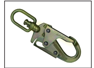
IKV 33 (ANSI Z.359.1-2007; CSA Z259.12-2011) mit Fallanzeiger