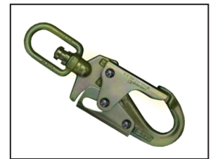
IKV 33 (ANSI Z.359.1-2007; CSA Z259.12-2011) mit Fallanzeiger